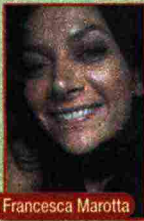
di Francesca Marotta