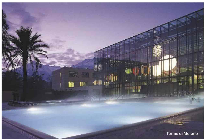
Terme di Merano

Al QC Termetorino, massaggi, trattamenti fangage, savonage, visage, modellage e vasche sensoriali.