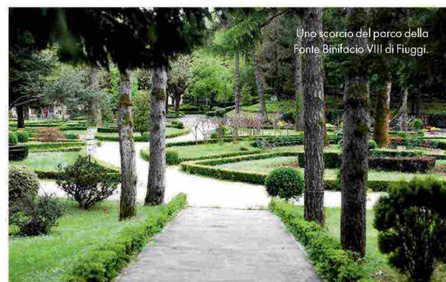
Uno scorcio del parco della Fonte Bonifacio VIII di Fiuggi.