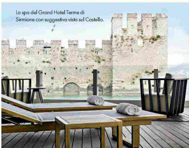
La spa del Grand Hotel Terme di Sirmione con suggestiva vista sul Castello.

In giornata: Aquaria Thermal Spa, spa termale con accesso su prenotazione: 1.000 metri quadrati di piscine e la stanza della sorgente dove gorgoglia l'idrogeno solforato. Nel menu: trattamenti viso, corpo e capelli. Aperta tutti i giorni dalle 9 alle 20, con ingressi a partire da 24 euro ( termedisirmione.com ).