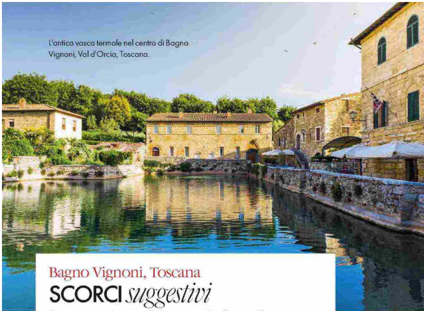
L'antica vasca termale nel centro di Bagno Vignoni, Val d'Orcia, Toscana.